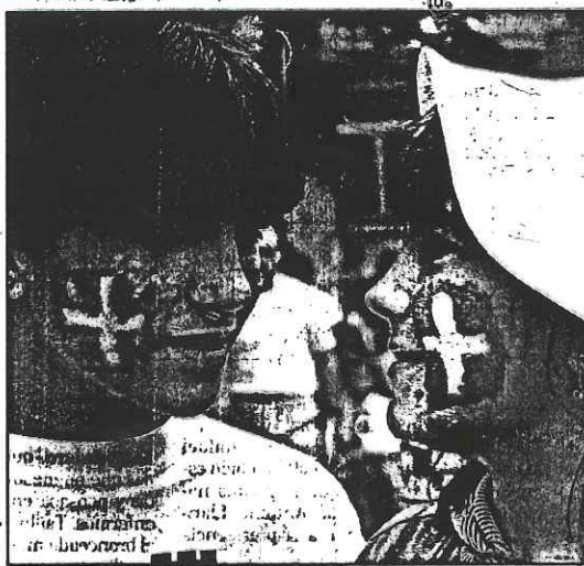
Las anteriores ediciones de Ibilaldia acapararon la atención de los jóvenes.

La ubicación de las txoznas provocó el pasado año polémica en el Consistorio, al negarse éste en un principio a su emplazamiento en la parte superior de El Prado. La situación de las txoznas durante las fiestas, obligará a desviar el tráfico rodado por la parte inferior del terreno escogido.