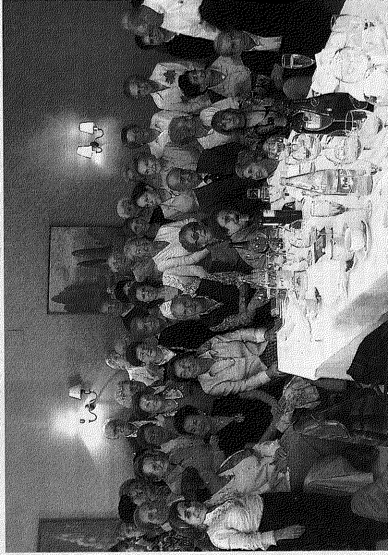
Las víctimas intercambian recuerdos de la Guerra Civil y la II Guerra Mundial en Gernika.