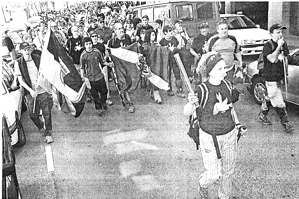
Un voluntaria porta el testigo de la marcha "Bakearen Bidea", ayer por las calles de Gernika. Iban Gorriti

EL PROYECTO "BAKEAREN BIDEA" LLEGA A GERNIKA DESPUÉS DE ATRAVESAR SUS COMPONENTES MEDIA EUROPA ANDANDO PARA UNIR PFORZHEIM Y GERNIKA