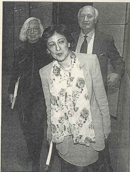
Margarita Robles, junto al presidente de la Fundación Sabino Arana.