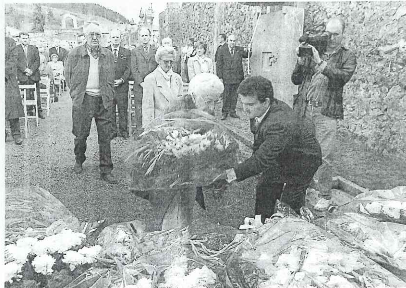
HOMENAJE. Un momento de la ofrenda floral, en un aniversario anterior del bombardeo.

Junto a esta producción alternativa, estarán presentes algunas cabañas de animales autóctonos como el euskal ollon, la azpi gorri, los pottokas o el asno de Encarnaciones. Se podrán disfrutar también de algunos puestos con especies exóticas, productos con label de calidad y denominación de origen, artesanía variada, maquinaria agrícola con exhibición de