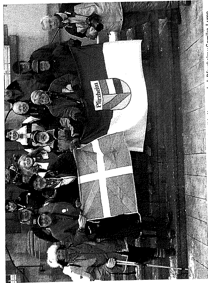
La iniciativa de paz "Bakearen Bidea" unió el año pasado la localidad hermanada de Pforzheim y Gernika-Lumo.