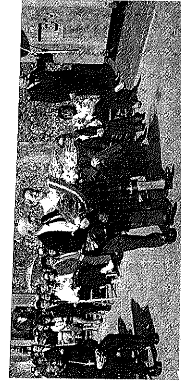
Los supervivientes participaron en la ofrenda floral en el cementerio.

Una hora antes del acto celebrado junto a la Casa de Juntas, la memoria del comandante en jefe del Euzko Gudarmatea recibió además el reconocimiento del Ayuntamiento de Gernika-Lumo con el