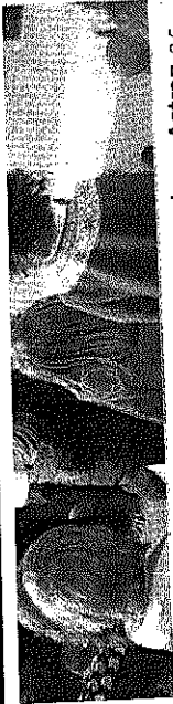
Antzeziana «Kukue dator!!!» antzeziana, Astran, o.c.