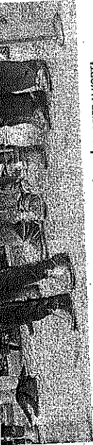
4 minutu Lau minutu, gogoetarako. ASIER ALKORTIA