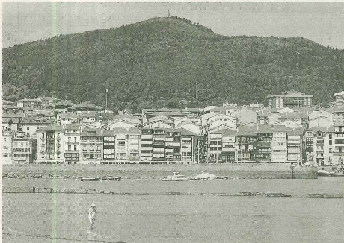
Lazunarra fue ideado siglos atrás para evitar la entrada de sedimentos del río Lea al puerto.