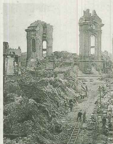
Dresde, tras el bombardeo.

Este hoja de ruta, puesta en marcha el pasado fin de semana por última vez, ha convertido el agua que se consume en Barakaldo y en varios municipios del entorno que también se abastecen de Oiola -como Sestao- "en el agua más segura y controlada de todo Euskadi", aseguran los socialistas. "Primero, porque el caudal se controla día y noche, y segundo porque el límite máximo de HCH o isómeros de lindane es de 20 nanogramos por litro, cuando el límite máximo en el resto de pantanos vascos es de 100 nanogramos por litro", explicó Tejada. "Según los expertos, la de Oiola es la de más calidad del territorio porque el pantano se abastece de los manantiales naturales de los montes de Triano". >T. DE LA ROSA