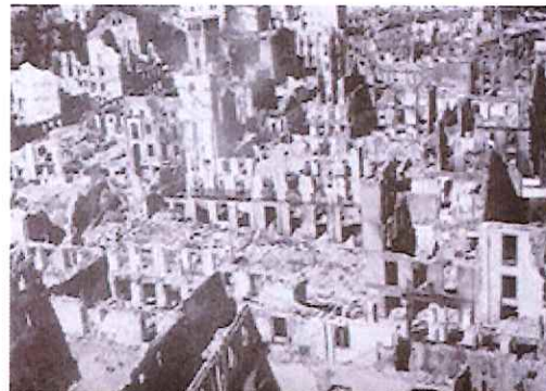
Vista de las ruinas de Gernika tras el bombardeo

El próximo 26 de abril la villa vasca de Gernika conmemorará el 70 aniversario de su bombardeo por la aviación alemana. El evento tendrá dimensión internacional y contará con la participación de varios Premios Nobel de la Paz y de alcaldes de Ciudades por la Paz, como Hiroshima y Nagasaki, Phorzheim, Auschwitz o Coventry. El programa de actos incluye la lectura de una declaración institucional internacional y una exposición que recreará de manera impactante los hechos de aquel fatídico 26 de abril de 1937.