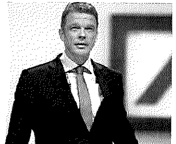
UNTERNEHMEN 16. April, 09:02 Uhr Deutsche-Bank-Chef fordert "echtes Binnenmarkt" für europäische Br