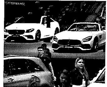
UNTERNEHMEN 16. April, 12:25 Uhr Gewinne der Automobilindustrie