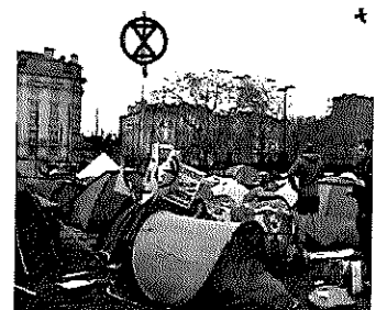
POLITIK 16. April, 12:27 Uhr