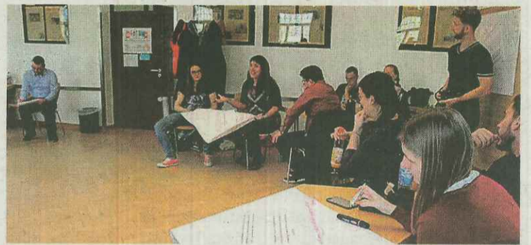
Proiektua prestatzeko egindako bilera, Weimaren (Alemania). G.G.

Jugoslavia zaharreko gatazka lekuetan zehar ibiliko dira abuztuaren 18tik 31ra bitartean. Besteren artean, Zagreb, Jasenovac, Pula, Vukovar eta Opatija bisitatu dituzte. Herri eta hiri horietan, gatazka desberdinen lekuko izan ziren tokiak bisitatu dituzte, bai eta gerra bizi zutenen