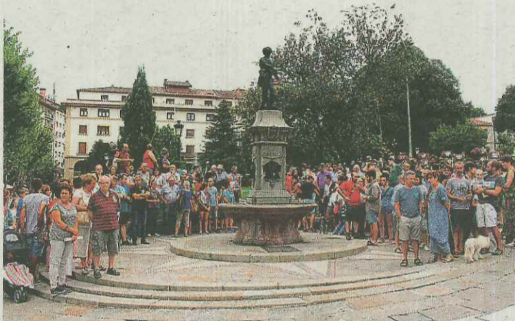
Gernika-Lumoko Merkurion egin zuten agerraldia, eguaztenean.

Ura «bizitzaren oinarria» dela azpimarratu zuten, eta bizirik dauden eta etorkizunean biziko diren herritarren oinarritzko eskubidea dela aldarrikatu zuten. «Badakigu nondik datörren ura, zelan erortzen den zerutik, zelan batzen den mendi tontorretan, eta zelan heltzen den ubideetatik ingurune honetara». Horre-