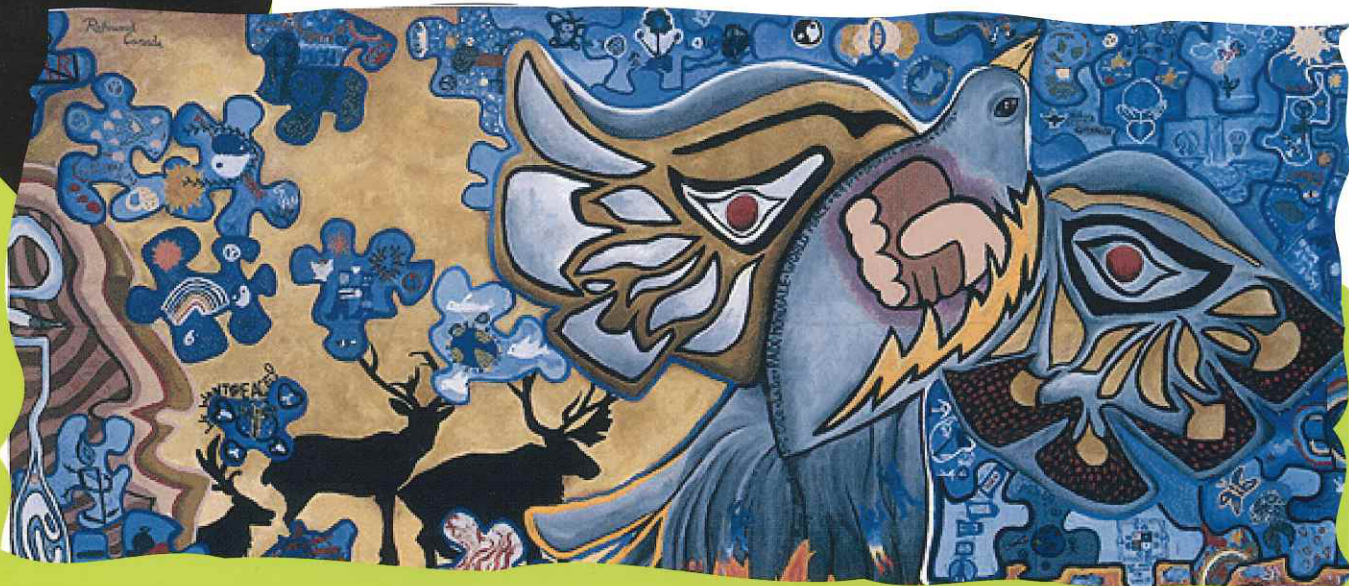
Richmond, Canada, 1997

NAZIOARTEKO BAKEAREN ALDEKO ARTE PROIEKTUA UN PROYECTO INTERNACIONAL DE ARTE POR LA PAZ AN INTERNATIONAL ART PROJECT FOR PEACE UN PROJET INTERNATIONAL D'ART POUR LA PAIX