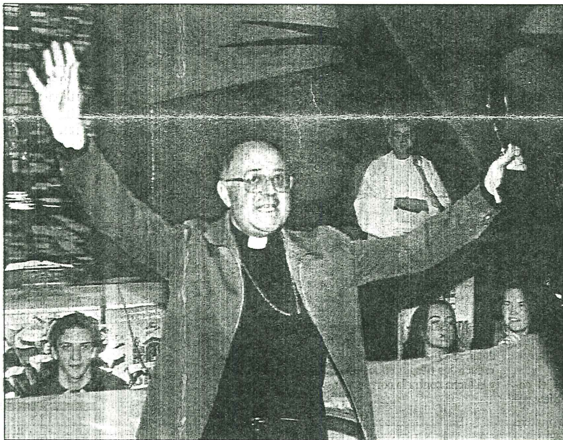
El obispo de Bilbao saluda a los fieles congregados en Urkiola paraguas en mano

Tres mil personas, entre las que se encontraba el obispo de Bilbao, Ricardo Blázquez, desafiaron al mal tiempo para realizar el recorrido a pie de diez kilómetros entre Mañaria y Urkiola. Desde primeras horas de la mañana la explanada de las canteras de Mañaria fueron acogiendo a los autobuses que llegaron a sumar una veintena y que transportaron a los participantes en este acto, procedentes de todo el territorio vizcaino. Página 7