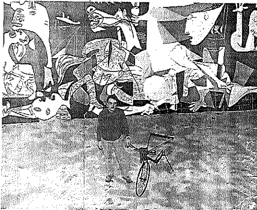
La muestra dedicada a Picasso fue inaugurada ayer. Kike Camba

El hall del centro socio-cultural se ha convertido en caso taurino presidido por el enorme Gernika, con gradas para los visitantes que desde allí pueden visionar el documental "La huella humana" en euskera y castellano.