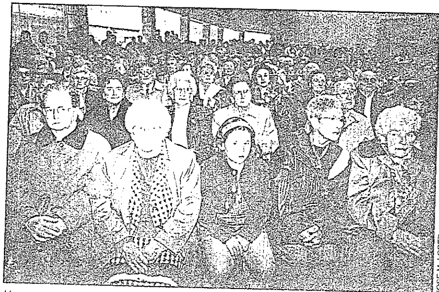
Un momento del acto realizado en homenaje a los supervivientes

Quiero terminar. Quiero exigir que la gran mentira, acuñada por el dictador, que agravó los dolores de la tragedia, enseñándose con los vascos, por la que nos acusaban de haber destruido nuestro propio pueblo, sea oficialmente desmontada y libere a los vascos de aquella ignominia, que aunque la historia aclaró desde el primer momento, oficialmente los gobiernos españoles nunca han reconocido.