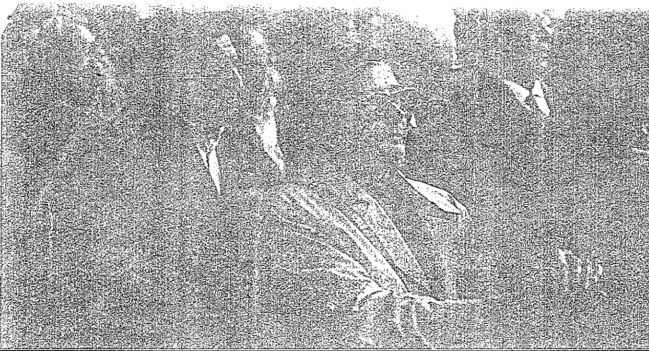
Los testigos supervivientes durante el acto

humana. De una verdad necesaria para la cultura y la obra de la paz.