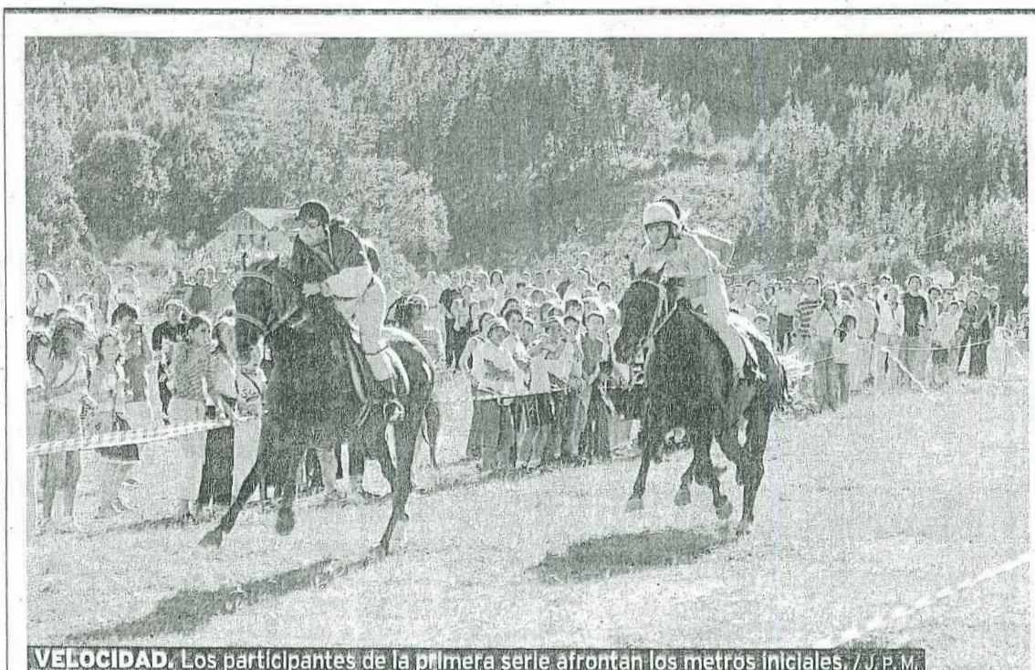
VELOCIDAD. Los participantes de la primera serie afrontan los metros iniciales.