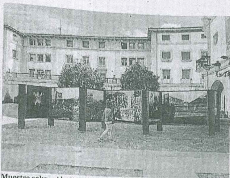
Muestra sobre el bombardeo abierta en Foru Plaza.