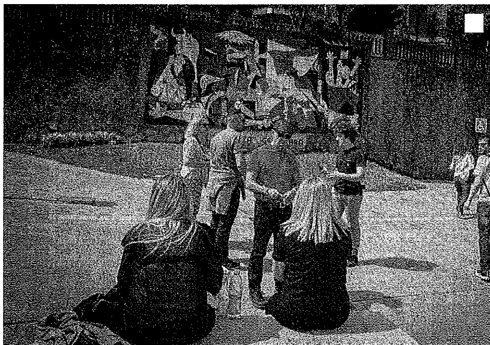
Turistas frente a la réplica en baldosa del cuadro 'Guernica' de Picasso. Maia Salguero

La UPV y Gernika Gogoratuz invitan a presentar propuestas para el intercambio académico, que tendrá lugar los días 13 y 14 de junio en la villa foral