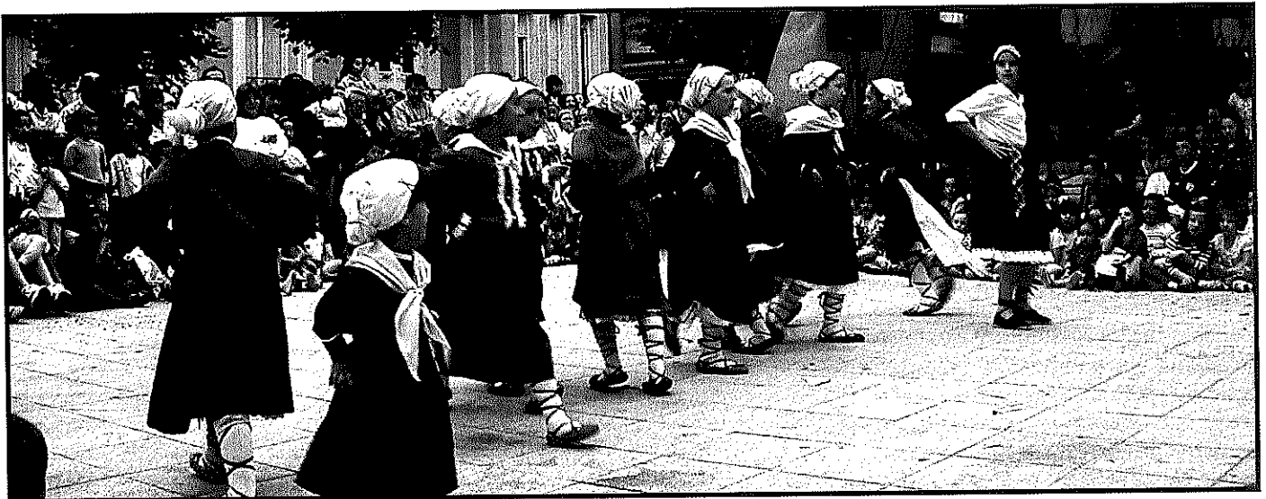
Grupo de danzas Elai Alai en fiestas de San Juan Ibarra, 2004

Se dan INICIATIVAS COMUNITARIAS como: los comedores escolares (Janguriek de KM 0, Jan Tokikoa Allende Salazarren eskolan); de consumo local (Lurgozo, Ortutik Ahora, Baserritik Gernikara); de agricultura sostenible (Bizisare, Errigora); ecología (Zero Plastikoa Urdaibai);